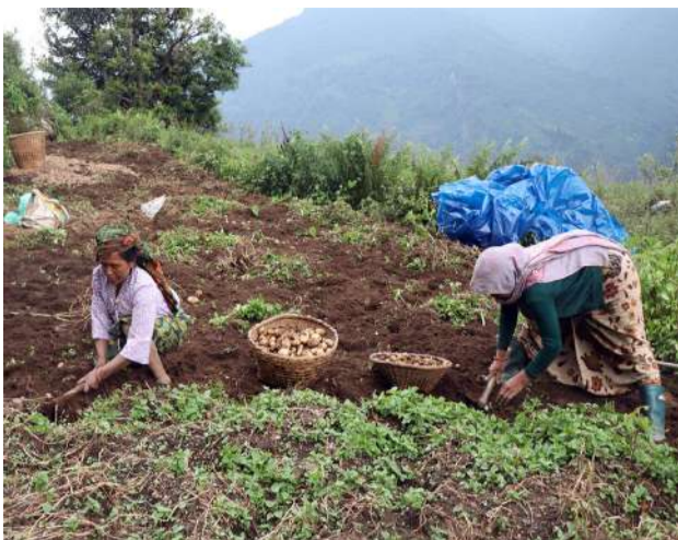
पोखरापत्र संवाददाता म्याग्दी, २५ जेठ