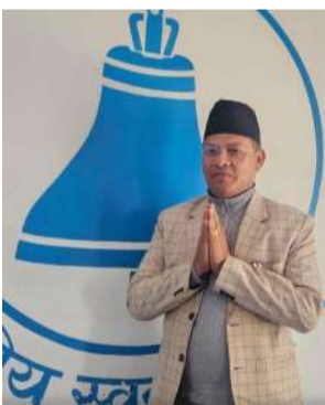
५ वर्षीय कार्यकालको लागि

पोखरामा शनिबार सम्पन्न प्रथम अधिवेशनले यातायात व्यवसायी केसी रास्वपा पोखरा महानगरपालिकाको