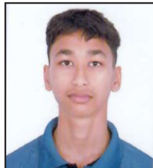
विधान श्रेष्ठ ३.४८ जिपिए