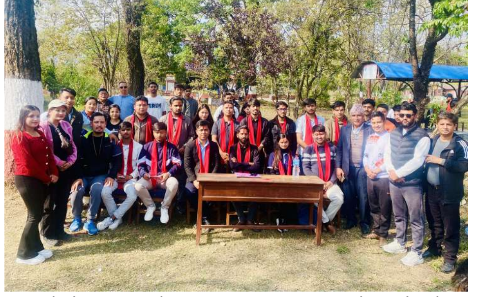
विद्यार्थी उम्मेदवार परिचय कार्यक्रममा सहभागी : आसन्न स्वतन्त्र विद्यार्थी युनियनको निर्वाचनमा पोखराको पृथ्वीनारायण क्याम्पसमा उम्मेदवार रहेका अखिल नेपाल राष्ट्रिय स्वतन्त्र विद्यार्थी (क्रान्तिकारी) का विद्यार्थीहरू शुक्रबार उम्मेदवार परिचय कार्यक्रममा सहभागी हुँदै।

५० माईक्रोनको शुक्राणु १०० माईक्रोनको अण्डा भित्र छिप्राई पनि सेचन गराउन सकिन्छ। यदी शुक्राणु र अण्डा सेचन गर्ने अनुकूल नभएमा शुक्राणु, र अण्डा लाई - १९६ डीजी सेन्ट्रोग्रेड Liquid Nitrogen को चिसो मा राखी भविष्यमा प्रयोग गर्न पनि सकिन्छ। साथै बनेको Embryo लाई पनि यसरी नै चिसोमा राखी भविष्यमा प्रयोगमा ल्याउन सकिन्छ। रोजगारीको लागि युवाहरूलाई बिदेश जानु अगाडी आफ्नो विर्यलाई फीजीक गरी जानुहुनको लागि सचेतना मुलक कार्यक्रम गर्नु आवश्यक महशुस भएको बताउदै उनीहरूको प्रजनन क्षमताको सुरक्षा गर्न सकिने डा. शर्माले भनाई थियो।