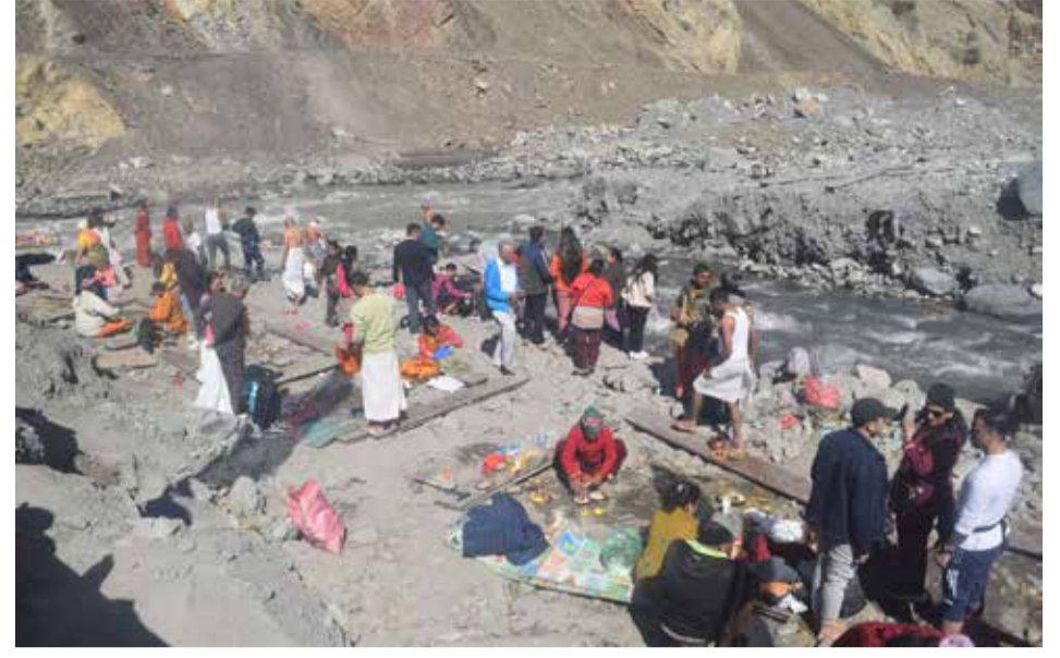
कागबेनीमा श्राद्ध गर्नेको घुइँचो

सिकारका लागि अनुमति दिएका नाउ, भारल र बँदेलको गरी कूल रु. एक करोड ४५ लाख ९२ हजार चार सय राजस्व आमदानी भएको छ । विदेशी सिकारी टोली आरक्षमा आइसकेका छन् । आरक्षलाई सुनदह, सेङ, दोगाडी, बाँसे, फागुने, सुर्तिवाङ, घुस्तुङ बलगमा विभाजन गरी शिकार खेल दिने व्यवस्था मिलाइएको छ । यहाँ ३२ प्रजातिका स्तनधारी वन्यजन्तु र १३७ प्रजातिका पंक्षीहरू छन् ।