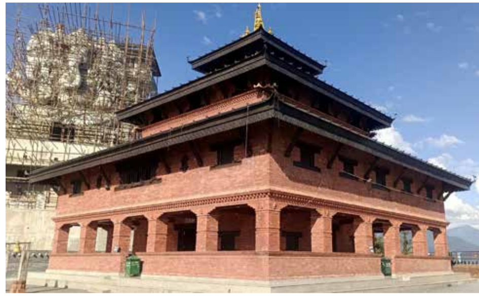
शिव मन्दिर र निर्माणाधीन पञ्चमुखे गणेशको मूर्ति: सराङ्कोट धार्मिक तथा पर्यटन क्षेत्र विकास समितिले पोखरा-१८, सराङकोटमा धार्मिक पर्यटकलाई लक्षित गरी निर्माण गरेको शिव मन्दिर र निर्माणाधीन पञ्चमुखे गणेशको मूर्ति।