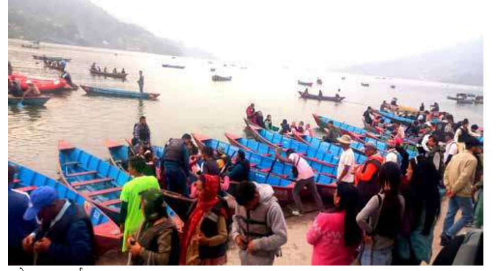
फेवातालमा पर्यटक: पोखराको प्रमुख पर्यटकीय गन्तव्य फेवाताल किनारमा शनिबार आन्तरिक पर्यटकको चहलपहल। पर्यटकीय मौसम शुरू भएसँगै पोखराको फेवाताल बीचमा रहेको बाराही मन्दिर दर्शन गर्न, फेवातालमा ढुङ्गा सयर गरेर मनोज्ञ लिन पर्यटक पोखरा आएका हुन।