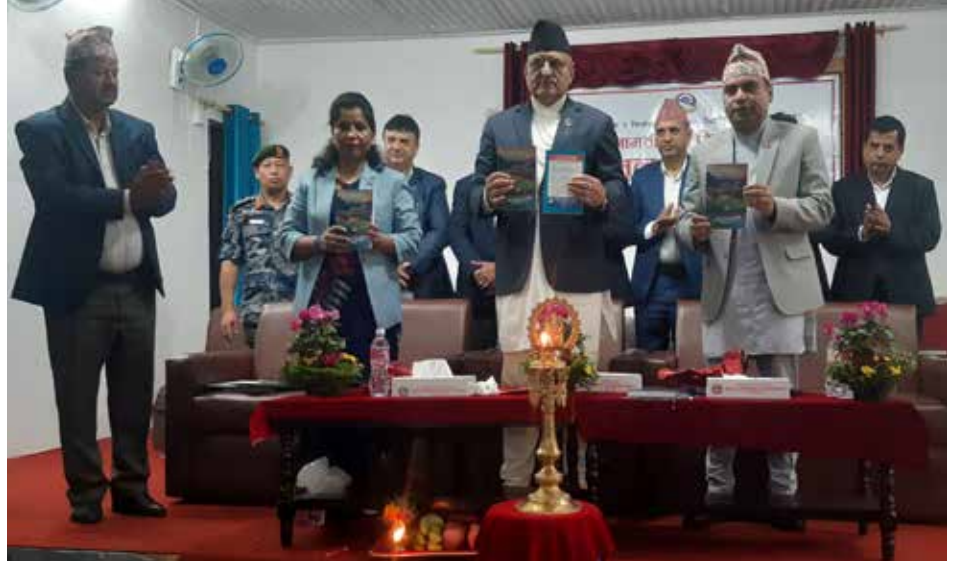
मुख्यमन्त्री पाण्डे-गोधुलीको सन्देश लोकार्पण : गण्डकी, २२ भदौ: निजामती सेवा दिवस २०८१ का अवसरमा आयोजित मूल समारोह समिति गण्डकी प्रदेशद्वारा आयोजित कार्यक्रममा पूर्वकर्मचारी परिषद्द्वारा प्रकाशित गोधुलीको सन्देश लोकार्पण गरिँदै ।

र सुख दुखमा साथ अनि औद्योगिक र व्यवसायिहरूको उत्थानका साथै सहज र शान्तिपूर्ण व्यवसाय गर्न सक्ने वातावरण बनाउनुनै मेरो लक्ष्य रहेको छ' उनले भने, 'कुनैपनि तहबाट राज्यको कानूनमा रहेर उद्योग-व्यवसायिहरूलाई यो वा त्यो वहानामा हतोत्साहित बनाइनु हुँदैन भन्नेमा म सचेत छु ।' संघमा अबको पालो आफ्नै भएकाले पनि अध्यक्षमा उम्मेदवारी दिएको उनले सुनाए । २०११ सालमा स्थापित संघ उद्योगि र व्यवसायिको आस्थाको धरोहर मात्र नभई पोखरोको संवृद्धिको सम्वाहक रहेको उनको भनाइ छ । संघको वर्तमान प्रतिष्ठा, स्वरूप र क्रियाशिलताका लागि अग्रजहरूले गरेको आर्थिक नैतिक र भावनात्मक रूपले पुऱ्याएको ठुलो योगदानको चर्चा गर्दै संस्थागत असल कार्यलाई निरन्तरता दिदै शिक्षा, स्वास्थ्य, कृषि, पर्यटन, औद्योगिकरण र उत्पादनलाई प्रवर्द्धन गर्दै बजार व्यवस्थापन गर्ने प्रतिबद्धता उनले व्यक्त गरे ।