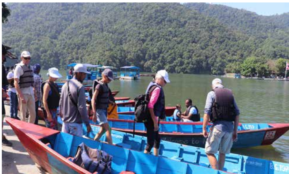
डुङ्गा चढ्दै विदेशी पर्यटक : देशको पर्यटकीय राजधानी पोखरास्थित प्रमुख पर्यटकीय गन्तव्य फेवातालमा शुक्रबार डुङ्गा चढ्दै विदेशी पर्यटक। मनसुन कम हुँदै जाँदा पोखरामा पर्यटक आगमन सुरु भएको छ।