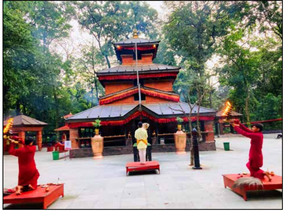
कालिका मन्दिरमा सन्ध्याकालीन आरती : गण्डकी प्रदेशको प्रसिद्ध धार्मिक पर्यटकीयस्थल कालिका मन्दिर। बागलुङ कालिका मन्दिरमा सन्ध्याकालीन आरतीसमेत गरिदै आइएको छ।

ढोरपाटन सिकार आरक्षका प्रमुख वरिष्ठ संरक्षण अधिकृत वीरेन्द्रप्रसाद कँडेलका अनुसार गत आर्थिक वर्षमा रु चार करोड ७९ लाख दुई हजार छ सय २८ राजस्व सङ्कलन भएको छ। अघिल्लो आर्थिक वर्ष २०७९/८० मा रु तीन करोड ४८ लाख राजस्व सङ्कलन भएको थियो। सहज यात्रा गर्दै सिकार गर्न पाउने अवस्था भएर बढी बढाउनमा सिकारी छानिने अवसरले राजस्व बढेको वरिष्ठ संरक्षण अधिकृत कँडेलले बताउनुभयो।