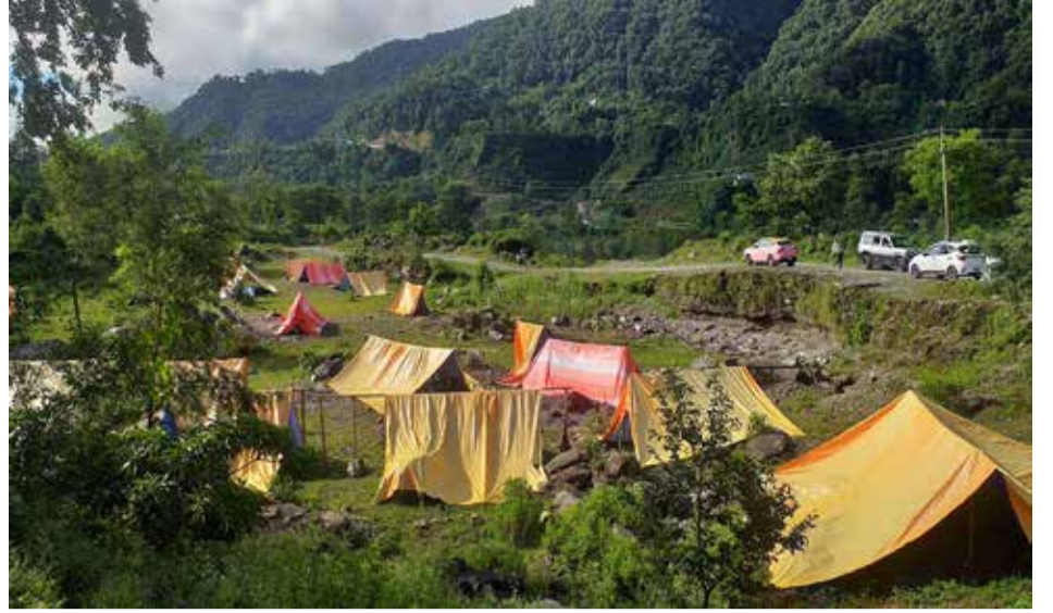
३९ घर परिवारको त्रिपालमुनि बास : पोखरा-१४ स्थित गस्ती टोलमा सेती नदीले असार २२ गतेको बाढीले घर बगाएपछि विस्थापित ३९ घर परिवारलागायतका त्रिपालमुनि बास बस्दै।

पब्लिककर्मिसँग साटिन्। उनले हरेक क्षेत्रमा काम गर्दा कामलाई भारी सम्भन् नहुने सुभाव दिइन्। पूर्णिमाको अदम्य साहसलाई बढवा दिन सम्मान गरिएको टेलिभिजनका प्रबन्ध निर्देशक क्षेत्रीले बताए। 'हामीले गरेको सम्मान अदम्य साहस भएको पत्रकारलाई गरेको सम्मान हो। धेरै जनाको प्रेरणाको स्रोत भएकी पर्वतारोहीलाई सम्मान हो', क्षेत्रीले भने। हिमाल आरोहणमानयौँपुस्ताकोप्रेरणाको स्रोत बन्न उनले शुभकामना व्यक्त गरे। श्रेष्ठ आरोहीसँगै फोटो पत्रकारसमेत हुन्। उनले ७ वर्ष अघि पर्वतारोहण सुरु गरेकी हुन्। सुरुवातमा मनास्लु हिमाल चढेकी उनले आठ हजार मिटरभन्दा अग्लो ८ वटा हिमाल आरोहण गरेकी छन्।