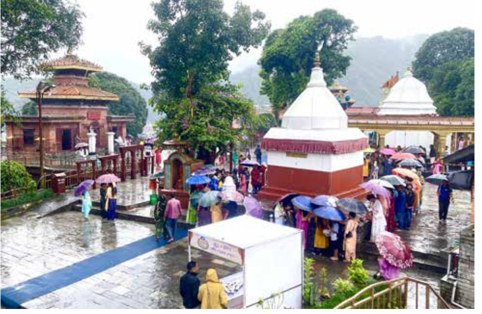
विन्ध्यवासिनी मन्दिरमा भक्तजन : पोखराको विन्ध्यवासिनी मन्दिरमा साउनको पहिलो सोमबार भरीका बीच पनि पूजा गर्न पुगेका भक्तजन।

सरकार र ट्याक्सी व्यवसायीबीच भाडा समायोजनलगायत विषयमा भएका कतिपय समझदारी कार्यान्वयनमा नआई अलपत्र परेका छन्। उक्त सहमतिपत्रमा भाडा तिरको बिल दिनुपर्ने, ट्याक्सीमा जिपीएस जडान गर्नुपर्ने, चालकको छुट्टै पोशाक हुनुपर्नेलगायत विषय उल्लेख थियो। पोखराका ट्याक्सी चालककले मनलादी रूपमा यात्रुबाट भाडा लिने गरेको विषय केही महिनाअघि गण्डकी प्रदेशसभाको अर्थ तथा विकास समितिमा समेत पुगेको थियो। समितिले पोखरामा चल्ने ट्याक्सीलाई मिटर प्रणालीमा सञ्चालन हुने व्यवस्था मिलाउन यातायात व्यवस्था मन्त्रालयलाई निर्देशन दिएको समितिका सभापति भोजराज अर्यालले बताउनुभयो। पोखरा अन्तर्राष्ट्रिय विमानस्थलबाट बाहिरिने यात्रुले ट्याक्सीलाई चर्को भाडा तिर्नुपरेको गुनासो गरेपछिसमितिलेविमानस्थलदेखि राजमार्गसम्म निःशुल्क सटल बस सञ्चालनका लागि सम्भाव्यता अध्ययन गर्न उक्त मन्त्रालयलाई निर्देशन दिएको थियो। ट्याक्सी भाडामा देखिएको मनोमानीको अन्त्यका लागि आफूले यातायात व्यवस्था मन्त्रालयका मन्त्रीलगायत पदाधिकारीसँग भेटेर पटकपटक छलफल गरेको सभापति अर्यालले बताउनुभयो।