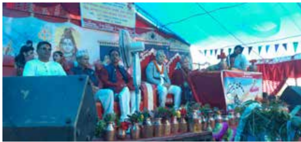
पोखरापत्र संवाददाता पोखरा, १४ साउन

पोखरा महानगरपालिका वडा नं ३३ शिववस्तीस्थित शुक्लेश्वर धाम प्राङ्गणमा आजदेखि श्रीमद्भागवत महापुराण, सप्तहा ज्ञान महायज्ञ, शिव महापुराण, बृहत धार्मिक श्रावण मेला एवम् बोलबम महोत्सव सुरु भएको छ ।