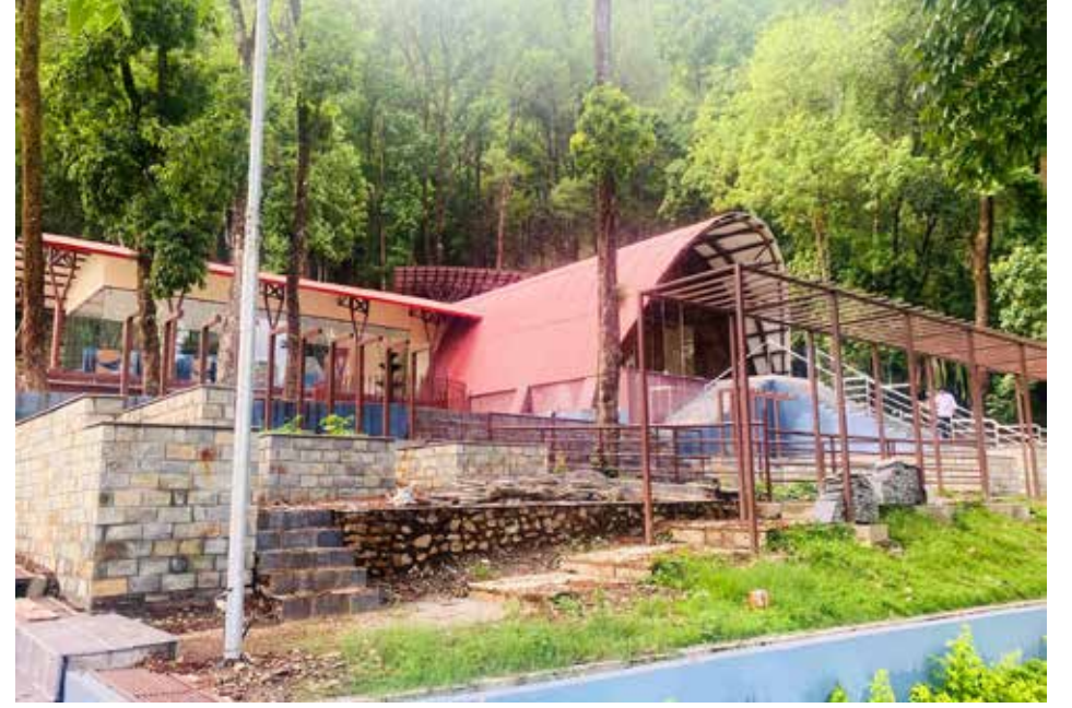
निर्माणाधीन संग्रहालय : कास्कीको पोखरा महानगरपालिका-१६ स्थित महेन्द्रगुफा परिसरमा निर्माणाधीन संग्रहालय भवन। गण्डकी प्रदेश सरकारको लगानीमा महेन्द्रगुफाको सौन्दर्यीकरण योजनामा सो संग्रहालय निर्माण कार्य सुरु गरिएको हो।

प्रतियोगितामा प्रथम हुने टिमले नगद १ लाख ११ हजार ११ र द्वितीय हुने टिमले ५५ हजार ५ सय ५५ नगद सहित टूर्नामेन्टल र प्रमाणपत्र प्राप्त गर्ने छन।