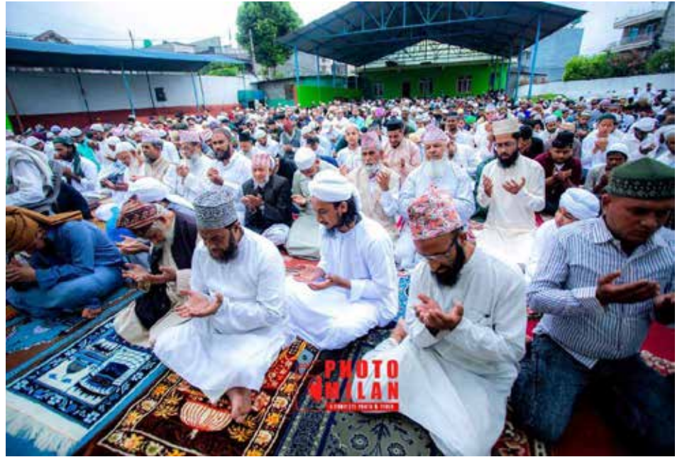
इस्लाम धर्मावलम्बीको पर्व बक्र ईद (उल-अजहा) का अवसरमा सोमबार पोखरा वडा नं. १३ मा मनाउदै ।