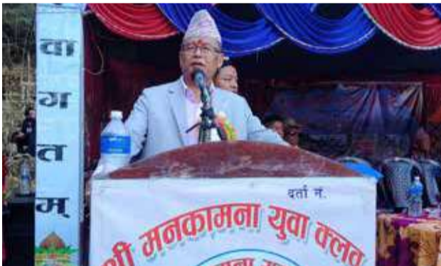
स्वार्थबन्दा माथि उठेर देश र जनतालाई सर्वोपरि ठानेर