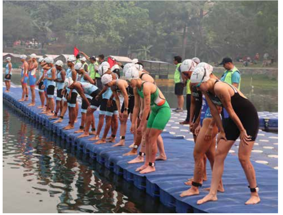
फेवातालमा पौडी प्रतियोगिता : नेपाल ट्रायथलन संघको आयोजनामा पोखरामा शनिबार भएको एसिया कप ट्रायथलन अन्तर्गत फेवातालमा पौडी प्रतियोगिता गर्दै खेलाडीहरू।