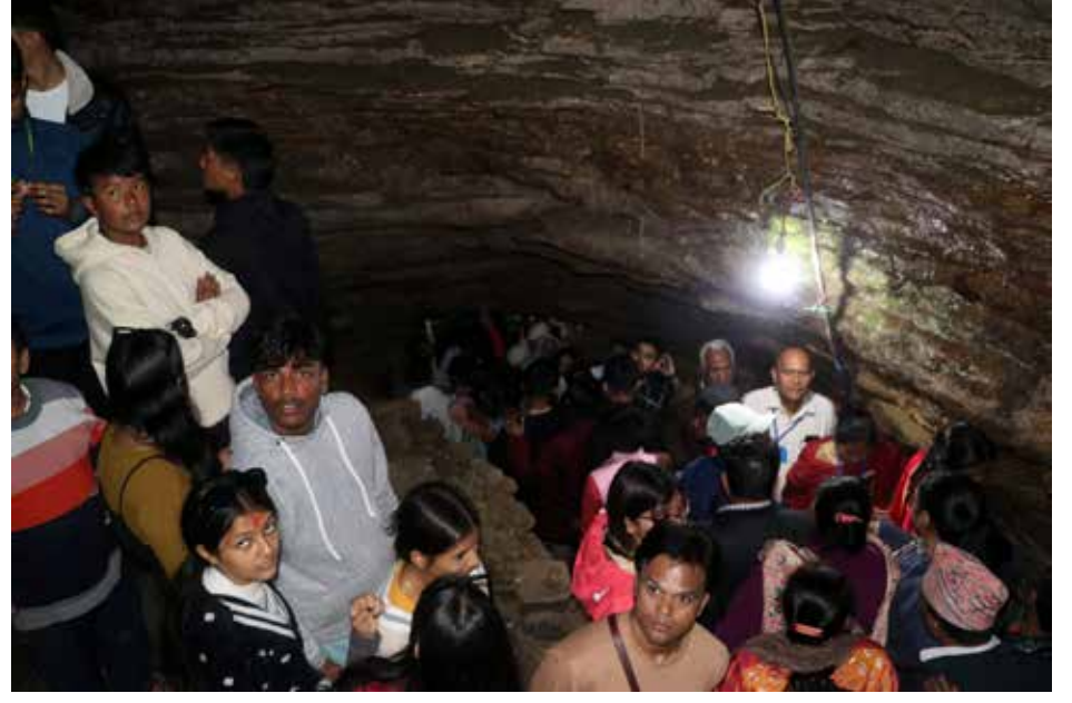
गुप्तेश्वर महादेव गुफा दर्शन: पोखराको छोरेपाटनस्थित ऐतिहासिक, धार्मिक एवम् पर्यटकीय क्षेत्र गुप्तेश्वर महादेव गुफा अवलोकन गर्ने तथा दर्शन गर्नेको घुइँचो। गुफाका साथै गुफाबाट पातले छाँगोको मनोरम दृश्यावलोकन गर्न आन्तरिक एवम् बाह्य पर्यटकको आकर्षण बढेको छ।