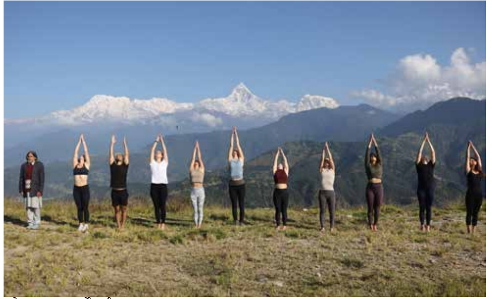
योग अभ्यास गर्दै पर्यटक: