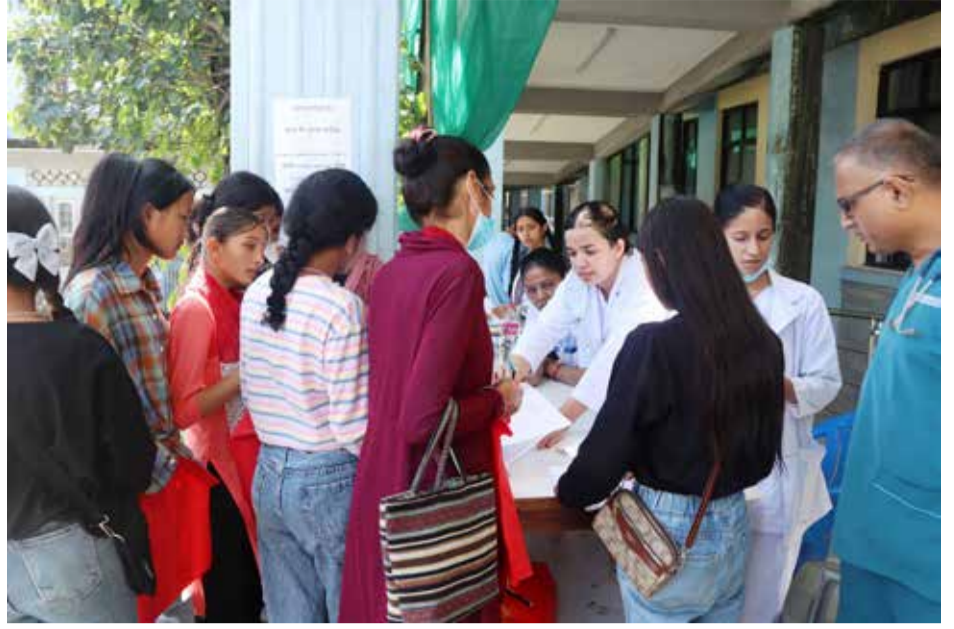
क्यान्सरविरुद्धको खोप : पोखरा स्वास्थ्य विज्ञान प्रतिष्ठान अन्तर्गतको पश्चिमाञ्चल क्षेत्रीय अस्पताल पोखरामा बुधबार किशोरीलाई पाठेघरको मुखको क्यान्सरविरुद्धको 'एचपिभी' खोप लगाउनका लागि नाम दर्ता गराउँदै स्वास्थ्यकर्मी।

विभागले आवश्यक अनुसन्धान सकेर १८ दिनपछि सुन प्रकरणको अनुसन्धानको जिम्मा प्रहरीको केन्द्रीय अनुसन्धान ब्यूरो (सिआइबी) लाई दिएको थियो। ब्रेक शुसहितको सुन एक सय ५५ किलो भएको पाइए पनि गाल्दा ६० किलो सात सय १६ ग्राम पुगेको थियो। उक्त सुन अहिले राष्ट्र बैंकको संरक्षणमा रहेको छ।