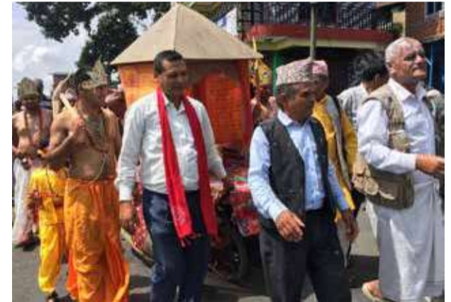
ऐतिहासीक स्थल कास्कीकोटमा श्रीकृष्ण जन्माष्टमीको अवसरमा दहीको होली खेलिएको हो । बाँकी अन्तिम पृष्ठमा ▶▶

बिहीवार दिउसो पोखरा २४ कास्कीकोटको भाद्रारी चोतारीमा विस्तारै मानीसहरू जम्मा हुन थाले । घर घर वाट दाँह ल्याएर भाडामा राख्दै भजन कृतन गर्न थाले । कोही श्रीकृष्ण भएका थिए । कोही राधा कोही कंश भएका थिए । कोही दहि एक आपसमा छेपा छेप गर्दै थिए कोही दहि खाँदै थिए । कोही भजन गाउँदै थिए । यो दृश्य देख्दा सत्य युगको भ्रलको होकी जस्तो लाग्यो ।