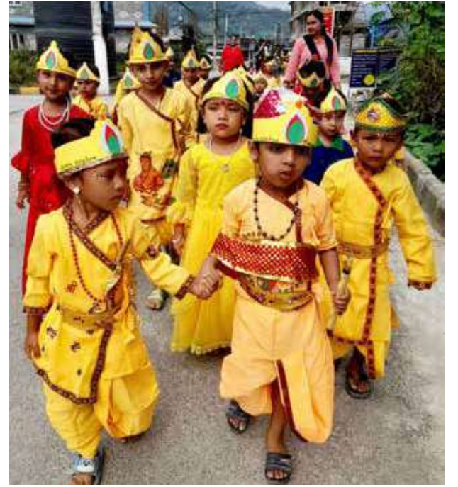
राधा-कृष्णको स्वरूपमा सजिएका बालबालिका : कृष्ण जन्माष्टमीको पूर्वसन्ध्यामा मंगलबार राधा-कृष्णको स्वरूपमा सजिएका पोखरा- १४ चाउथेमा रहेको ज्ञानगंगा स्कुलमा अध्ययनरत बालबालिका ।