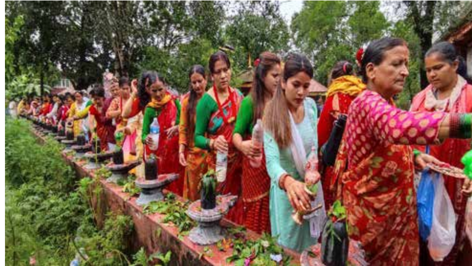
शिबलिङ्गमा गाईको दुध र बेलपत्र अर्पण गर्दै भक्तजनः केदारेश्वर मन्दिर पोखरामा शिबलिङ्गमा गाईको दुध र बेलपत्र अर्पण गर्दै भक्तजन ।