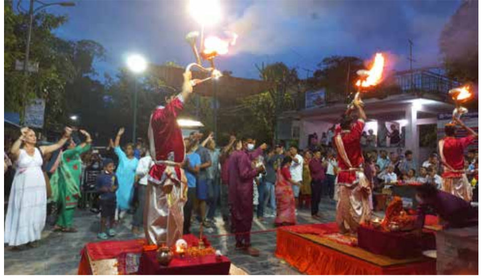
आरतीमा रमाउँदै: फेवाताल किनारास्थित बाराही घाटमा शुक्रबार आयोजित सन्ध्याकालीन आरतीमा रमाउँदै आन्तरिक एवं बाह्य पर्यटक।

लैजादा, एउटै पोखरीको पानी खुवाउँदा, साभा सुईको प्रयोगलगायत कारणले 'लम्पी स्किन' गाईभैसीमा सर्ने गरेको उहाँले बताउनुभयो। सङ्क्रमित गाईभैसीको ओसारपसार नै यो रोग फैलिनुको मुख्य कारण रहेको पशु चिकित्सक बताउँछन्। उक्त रोगको औषधि पत्ता नलागेकाले खोप नै बढी प्रभावकारी हुने महाशाखा प्रमुख डा न्यौपानेले बताउनुभयो। उहाँका अनुसार लामखुट्टे, किर्नाजस्ता टोक्ने किराबाट 'लम्पी स्किन' गाईभैसीमा सर्ने गरेको छ। भाइरसको प्रकृतिअनुसार १० देखि १५ दिनमा रोग निको हुने उहाँले जानकारी दिनुभयो। 'लम्पी स्किन' रोग लाग्दा गाईभैसीमा उच्च ज्वरो आउने, तौल घट्ने, छालामा गाँठगाँठ आउनेजस्ता लक्षण देखिने गरेको छ। सयममै सङ्क्रमण नियन्त्रण गर्न नसके ठूलो पशुधनको क्षति व्यहोर्नुपर्ने अनुमान नेपाल पशु चिकित्सा परिषदले गरेको छ।