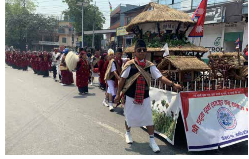
ट्रोट्टे र्याली : तमु समुदायको एतिहासिक, साँस्कृतिक पर्व ट्रोट्टेका अवसरमा तमु धि नेपालले आयोजना गरेको र्यालीमा सहभागीहरू।