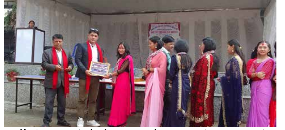
एसईई परीक्षामा सहभागी हुनेलाई शुभकामना: पोखरा महानगरपालिका वडा नं १३ स्थित भद्रकाली माविमा कक्षा ९ मा अध्ययनरत विद्यार्थीहरूले २०७९ को एसईई परीक्षामा सहभागी हुने विद्यार्थीहरूलाई शनिवार गरिएको शुभकामना कार्यक्रम।