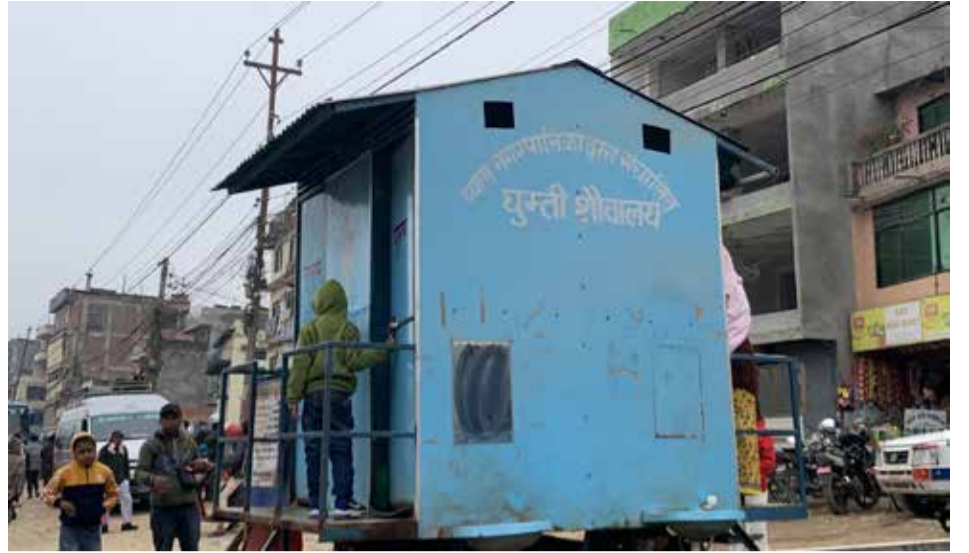
तनहुँको व्यास नगरपालिका-४ स्थित भोर्लेटारचोकमा राखिएको घुम्ती शौचालय। व्यास नगरपालिकाले सञ्चालनमा ल्याएको घुम्ती शौचालयले सर्वसाधारणलाई राहत मिलेको छ।