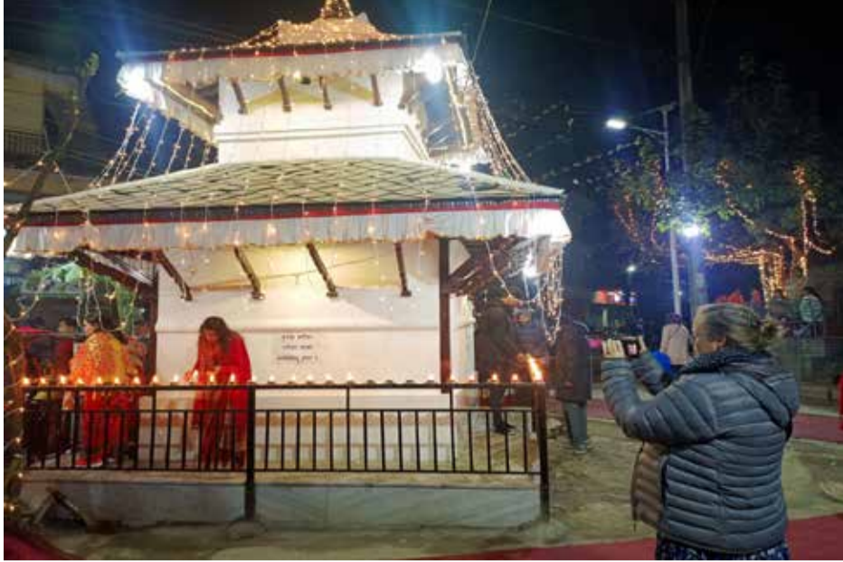
पोखरा ३, तेसापट्टीस्थित जलविनायक मन्दिरमा स्थानीय महिलाले दियो बाल्दै गरेको तस्बिर लिँदै विदेशी महिला पर्यटक ।