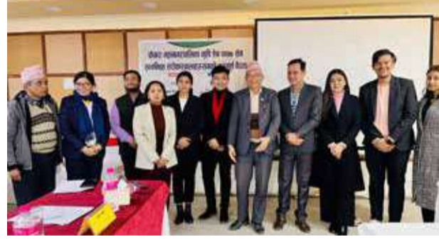
महानगरपालिका कृषि तथा पशु विकास महाशाखा, कृषि सञ्जाल, कृषि बजार, लगायत सम्पूर्ण कृषि क्षेत्रमा सरोकार राख्ने २५ भन्दा बढी व्यक्ति सहभागी रहेको थियो । महानगरपालिकाले