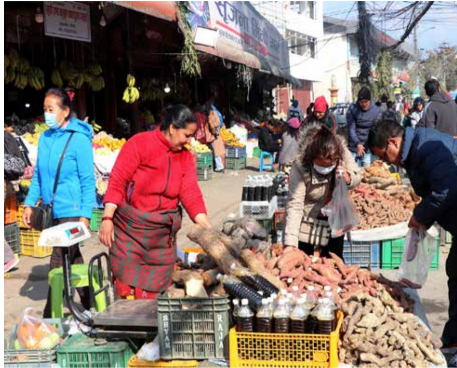
तरुल किनबेच: पोखराको सृजनाचोकमा माघे संक्रान्तिका लागि बिक्रीमा राखिएका तरुल, सक्खरखण्ड खरीद गर्दै सर्वसाधारण ।