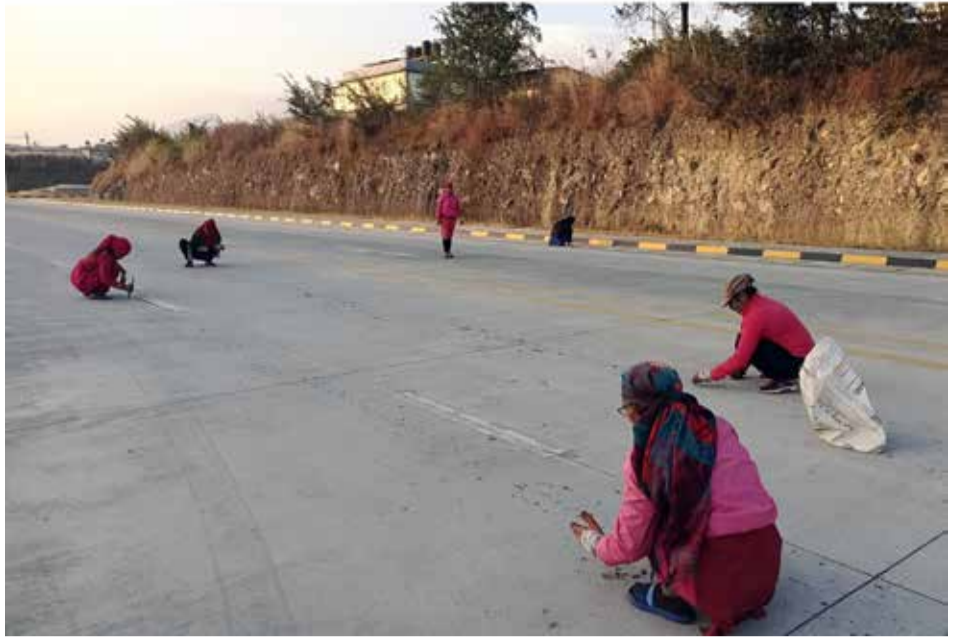
पोखरा अन्तर्राष्ट्रिय विमानस्थलको प्रवेश मार्गमा लागेको अलकत्रा सफा गर्दै कामदार ।