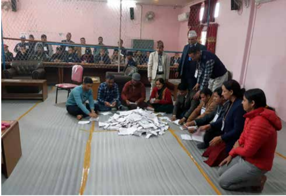
मत गणना: कास्की निर्वाचन क्षेत्र नं १ को मत गणना गर्दै कर्मचारी ।

□ वर्ष २३ □ अङ्क २९३ □ श्रेणी क्षेत्रीय 'क' □ २०७९ मंसिर ६ गते मंगलबार □ 22 Nov. 2022 □ पृष्ठ ४ □ मूल्य रु. ५।-