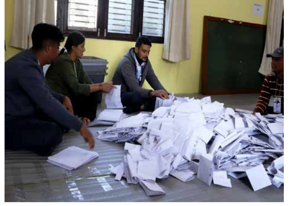
जिल्ला समन्वय समितिको सभाहलमा सोमबार कास्की निर्वाचन क्षेत्र नं ३ को मतगणना गरिँदै ।

उहाँ भन्नुहुन्छ, “माछापुच्छ्रे गाउँपालिका अलैंचीको व्यावसायिक खेती निकै राम्रो छ, किसानले उत्साहित रूपमा व्यक्तिगत र समूहमा गरेर अलैंची खेती गरेका छन् ।” उहाँले क्रमशः अलैंची खेतीको क्षेत्र विस्तार भएकाले आगामी दिनमा उत्पादन बढ्ने र गाउँ अलैंचीबाट आत्मनिर्भर हुने अवस्थामा रहेको उल्लेख गर्नुभयो । उहाँका अनुसार अनुदानबाट सिँचाइ र अलैंची सुकाउने आधुनिक भट्टी निर्माणमा ८५ प्रतिशत अनुदान उपलब्ध गराइएको छ भने क्षेत्र विस्तार कार्यक्रम, चकलाबन्दी, उपकरण, नर्सरी, अलैंचीको बेनालगायतमा ५० प्रतिशत अनुदान दिने गरिएको छ ।