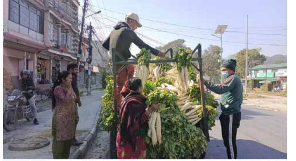
पोखराको रत्नचोकमा नुवाकोटका किसानले उत्पादन गरेको मूला बिक्री गर्दै व्यापारी। प्रति मूला मूलाको रु एक सयमा बिक्री वितरण गरिएको छ।