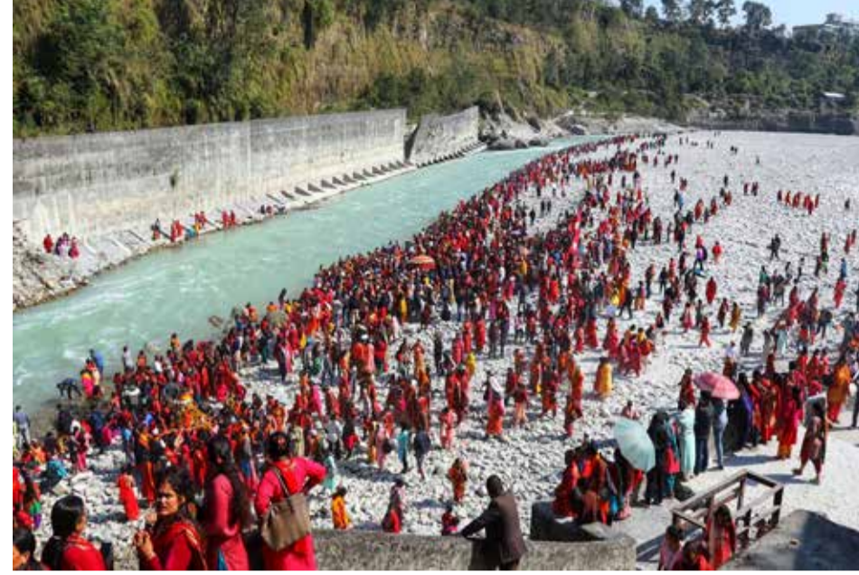
हरिबोधनी एकादशीमा पोखराको रामघाटमा शुक्रबार जम्मा भएका भक्तजनहरूको घुइँचो।

प्रतियोगिताअन्तर्गत शुक्रबार भएको खेलमा सहलेस युथ क्लब सिराहाले क्यामरुनको एभिनीयर फुटबल क्लबलाई २-१ ले हराउँदै सेमिफाइनलमा स्थान बनाएको छ। सिराहाका लागि दुबै गोल फोडे फोफोनाले २ गरे। फोफोनाले खेलको ७ औं र ६७ औं मिनेटमा गोल गरे। फोफोनाले दास्रो गोल पेनाल्टीमा गरेका थिए। एभिनीयरका लागि एकमात्र गोल सोडले गरेका हुन्। सिराहाका पेपे म्यान अफ दी म्याच बने।