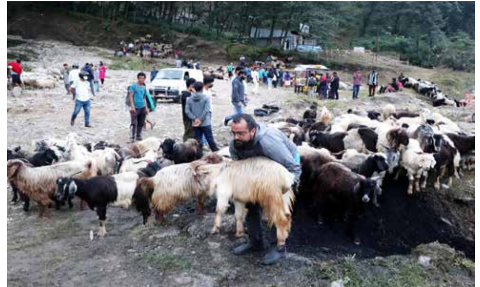
पोखराको सिम्पानीमा शनिबार साँझ बिक्रीका लागि राखिएका च्याडग्रा छान्दै एक ग्राहक । विगतका वर्षहरूमा भन्दा यस वर्ष भेडा, च्याडग्रा महंगो भएको गुनासो उपभोक्ताको छ ।