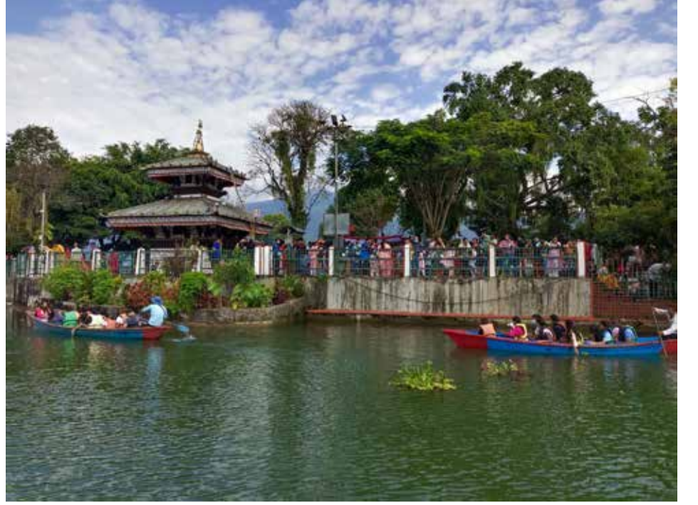
नवरात्रको समय पारेर शनिबार पोखराको फेवाताल बिचमा रहेको तालबाराही मन्दिर दर्शन गर्ने भक्तजनको घुइँचो।

उजुरी दर्ता भएयता लामिछाने प्रहरीको फरार सूचीमा दर्ज भएका छन्। क्यारेबियन लिगका लागि जमैका गएका लामिछाने नेपाल नफर्केपछि प्रहरीले उनीविरुद्ध अन्तराष्ट्रिय प्रहरी संगठन इन्टरपोलले डिफ्युजन नोटिससमेत जारी गरेको छ।