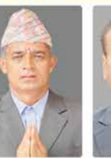
यमनाश थिमिर्स्या कार्यसमिति सदस्य पदका उम्मेदवार