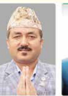
हीम गौतम कार्यसमिति सदस्य पदका उम्मेदवार