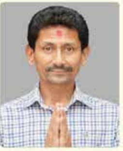
उत्तममान बुढावाय उपाध्यक्ष (वाणिज्य) पदका उम्मेदवार