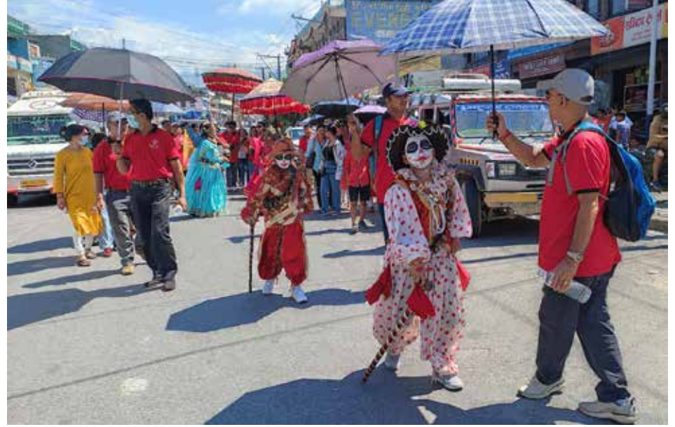
दिवंगत आफन्तको सम्झनामा मनाइने गाईजात्रा पर्वका अवसरमा शनिबार पोखरामा निकालिएको गाईजात्रा। यो वर्ष जनैपूर्णिमा र गाईजात्रा एकै दिन शुक्रबार परेपनि जनैपूर्णिमाको भोलिपल्ट गाईजात्रा निकाल्ने प्रचलन अनुरूप यहाँका नेवार समुदायले शनिबार गाईजात्रा मनाएका छन्।

भएपछि आयोगले गत असार १ देखि मतदाता नामावली सङ्कलन सुरु गरेको थियो। सरकारले यही साउन १९ गते आगामी मङ्सिर ४ गते देशभर एकै चरणमा प्रतिनिधिसभा र प्रदेशसभा सदस्य निर्वाचन गर्ने निर्णय गरेको थियो। निर्वाचनको मिति घोषणा भएसँगै आयोगले साउन २० गतेदेखि मतदाता नामावली सङ्कलनको काम स्थगन गरेको थियो। आगामी भदौ १२ देखि १९ गतेसम्म निर्वाचन कार्यालयमा पुगी मतदाता नामावली अद्यावधिक बाँकी अन्तिम पृष्ठमा ▶▶