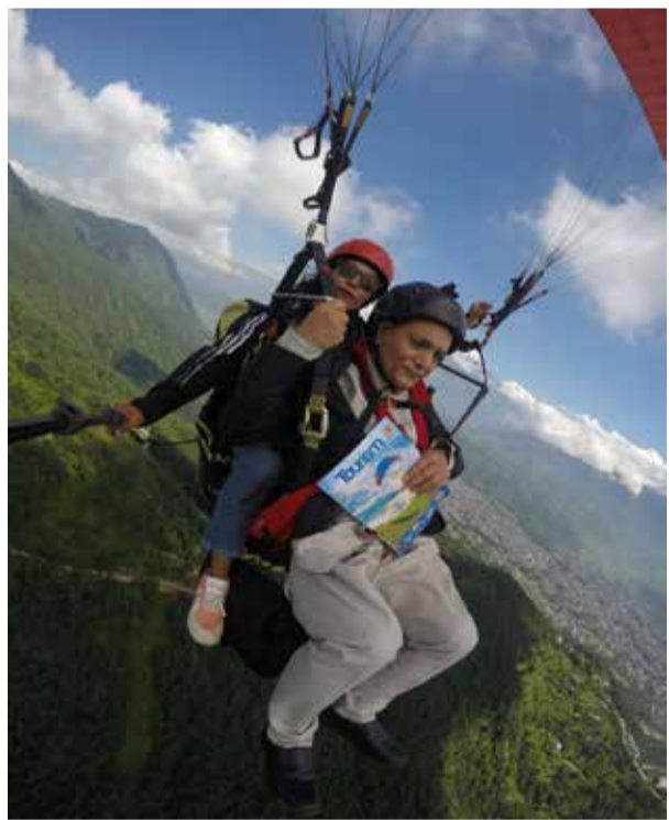
पर्यटन प्रवर्द्धनमा महत्वपूर्ण भूमिका खेल्ने विश्वास व्यक्त