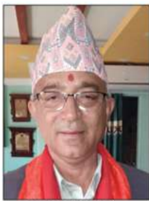
धनराज आचार्य मेयर