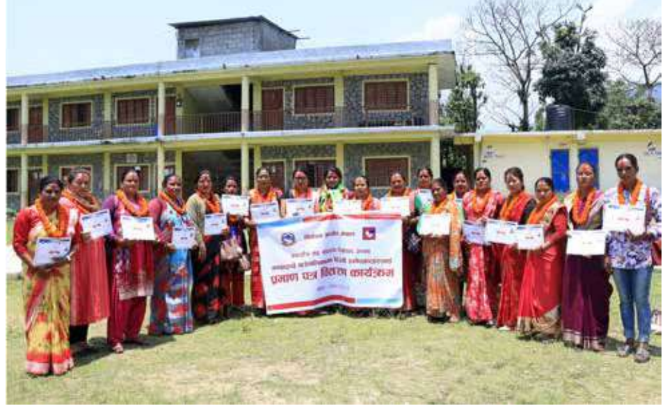
नवनिर्वाचित जनप्रतिनिधि: कास्कीको माछापुच्छ्रे गाउँपालिकाका नौ वटा वडाबाट विजयी महिला जनप्रतिनिधिहरू प्रमाणपत्रका साथमा।

उता हरिनास गाउँपालिकाको अध्यक्ष र उपाध्यक्षमा एमालेले जित हात पारेको छ। अधिल्लो निर्वाचनमा जित हासिल गरेका एमालेका उम्मेदवारहरू यसपटक पनि विजयी भएका छन्। मतगणना जारी रहेको वालिङ र चापाकोट नगरपालिकाको नजिता सार्वजनिक हुन केहि समय लाग्ने निर्वाचन कार्यालयले जनाएको छ।