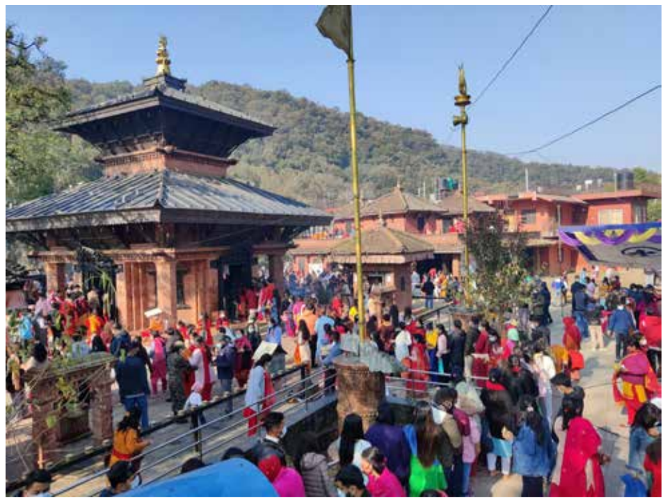
केदारेश्वर मन्दिरमा भक्तालुहरु : पोखराको केदारेश्वर मन्दिरमा भक्तालुहरुको भिड। पोखरा महानगरपालिका-६ कोमागाने पार्कीस्थित केदारेश्वर मन्दिरमा महाशिवरात्रिका अवसरमा दर्शन गर्न आएका भक्तालुहरु।