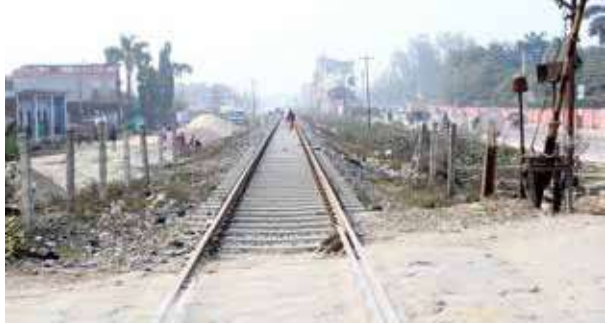
रेल सेवा सञ्चालनको तयारी बाँकी अन्तिम पृष्ठमा >>>

रासस जनकपुर, २६ माघ धनुषाको कुर्थादेखि भारतको जयनगरसम्म रेल सेवा सञ्चालन हुने निश्चित भएपछि नेपाल रेल्वे कम्पनीले रेलको लिकमा अव्यवस्थित रूपमा लाग्दै आएको हाटबजार हटाउन सुरु गरेको छ। अगामी महिनादेखि