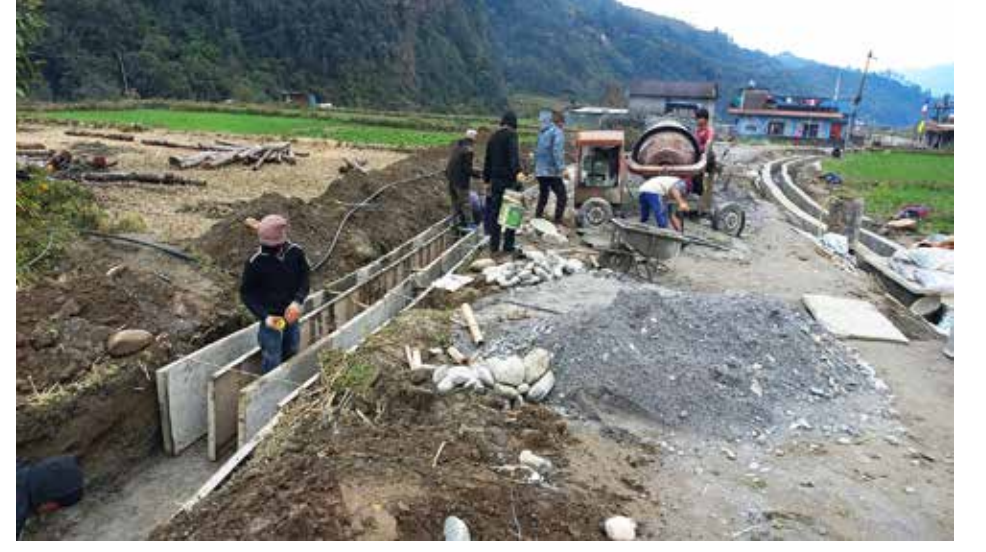
सडक स्तरोन्नति गरिँदै: कास्कीको माछापुच्छ्रे गाउँपालिका-२ स्थित सार्दीखोला-बाँभरखेत-देउराली हुँदै कोलचोक भुर्जुङखोला सहायक सडक स्तरोन्नति गरिँदै। गण्डकी प्रदेश सरकारको चालू आर्थिक वर्षको रु एक करोड बजेटबाट दुई किमी सडक स्तरोन्नति गरिँदै छ।