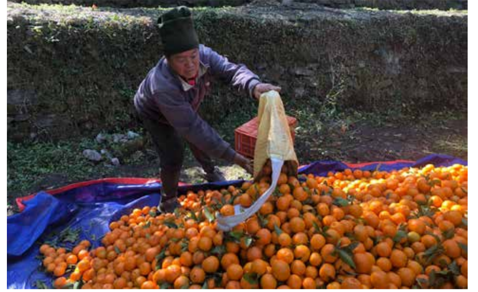
सुन्तला: म्याग्दीको अन्नपूर्ण गाउँपालिका-७ दोसल्लेका कृषक बगैचामा टिपेको सुन्तला संकलन गरेर बजार पठाउने तयारी गर्दै ।