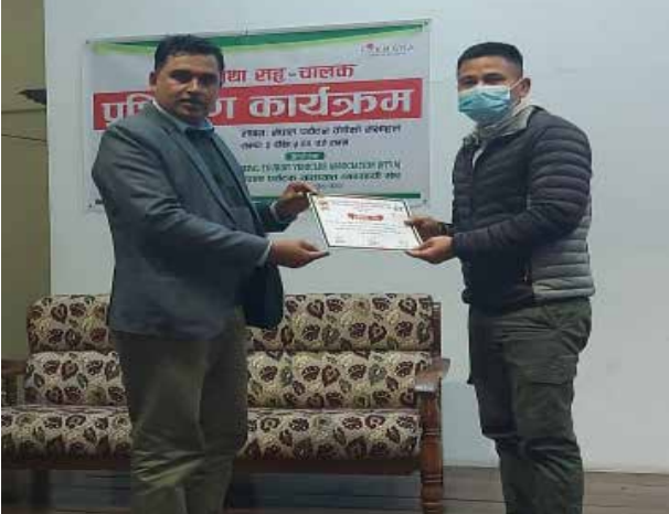
तालिमका क्रममा सहभागीलाई ट्राफिक निति नियम, यात्रुलाई गरिने आतिथ्यता तथा व्यवहार, सुरक्षा तथा प्राविधिक पक्षबारे जानकारी गराइएको थियो। पर्यटकहरू सर्वप्रथम चालक