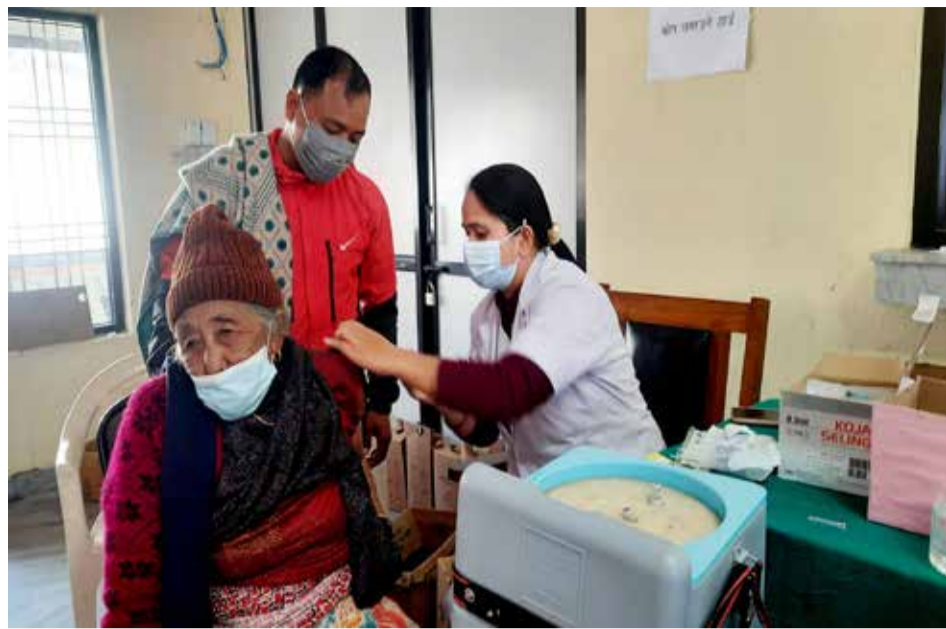
फाइजरको दोस्रो डोज लिँदै ज्येष्ठ नागरिक: पश्चिमाञ्चल स्वास्थ्य विज्ञान प्रतिष्ठान पोखरामा कोरोनाविरुद्ध खोप फाइजरको दोस्रो डोज लिँदै ज्येष्ठ नागरिक।