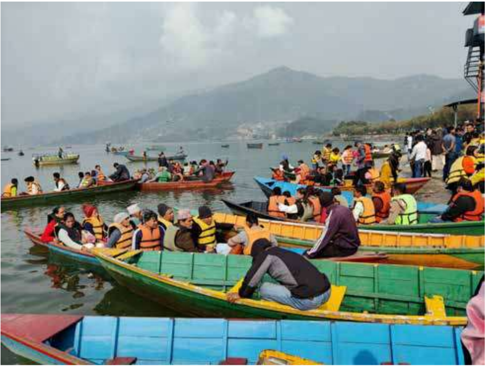
आन्तरिक पर्यटकको भिडः शनिबार दिउँसो पोखराको फेवातालमा डुङ्गा शय र तथा तालबाराही मन्दिर दर्शनका लागि आएका आन्तरिक पर्यटकको भिड।