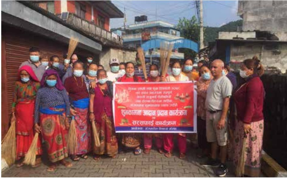
घटस्थापनाको अधिल्लो दिन संगमटोल विकास संस्था-१३ ले शुभकामना आदान प्रदान कार्यक्रम तथा सरसफाई कार्यक्रम गरेको छ।