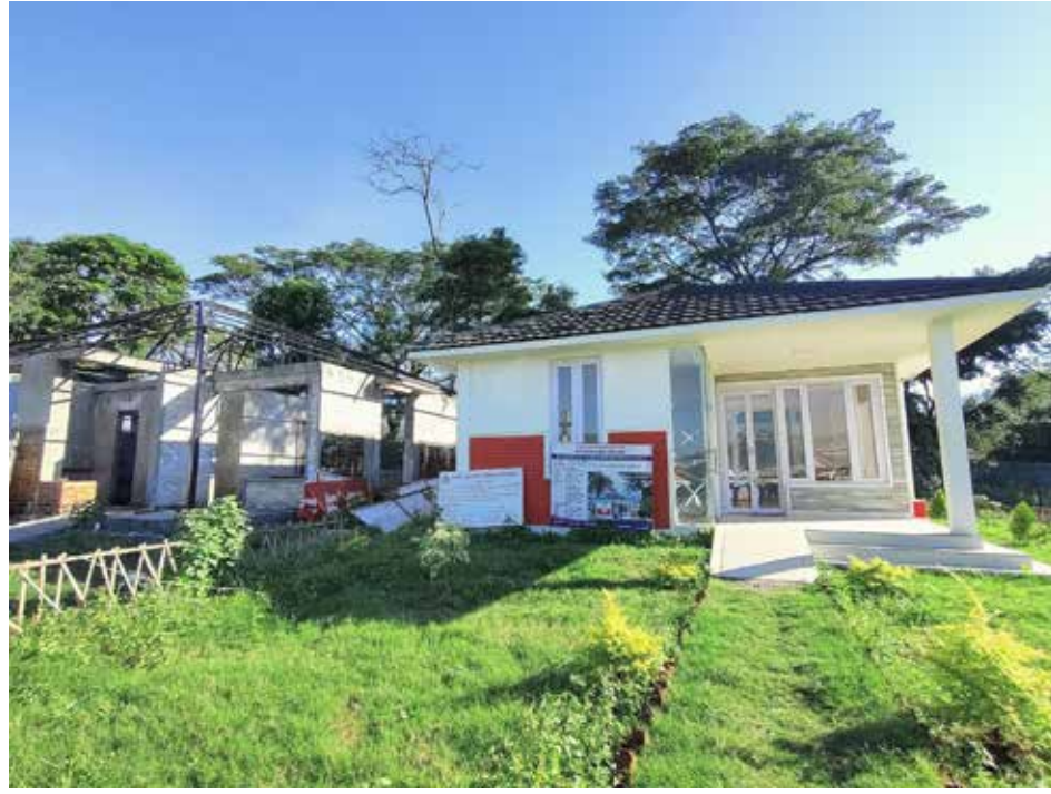
निर्माणधीन विन्ध्याबासिनी प्राकृतिक चिकित्सालय : निर्माणधीन पोखराको विन्ध्याबासिनी प्राकृतिक चिकित्सालय। पोखरा महानगरपालिका-१ गुठीबारी मार्गमा विन्ध्याबासिनी धार्मिक क्षेत्र विकास समितिबाट प्राकृतिक चिकित्सालयको निर्माण गर्न लागिएको हो।