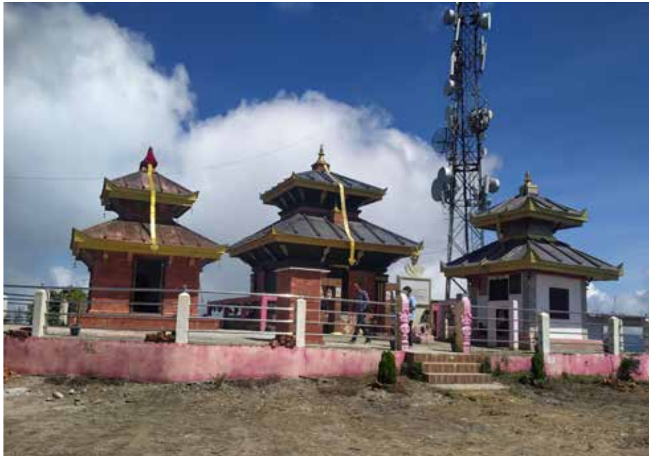
गह्रौसुर कालिका मन्दिर: स्याङ्जाको वालिङ-८ र गल्याङ -१० को सङ्गमस्थल गह्रौसुरमा अवस्थित गह्रौसुर कालिका मन्दिर।

कोत, घण्टाघर, सुरक्षाकर्मीले पहरा दिने कोठा र चोक भएकाले भग्नावशेषलाई दरबारकै रुपमा उठाउनुपर्ने योजना बनेको शर्माले बताउनुभयो। गाउँपालिकाले भीमापोखरा हुँदै धम्जा, तंग्राम, बिहुँतर्फको पहाडी कोरिडोर रेखाइ कन गरेको छ। वडा नं १ को पाला, कालीमाटी हुँदै सदरमुकाम जोड्ने सडक पनि स्तरीय बनाउन काम सुरु भएको छ।