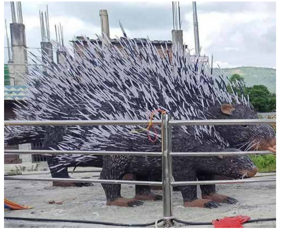
दुम्सीको मूर्ति : तनहुँको व्यास नगरपालिका-१० दुम्सीचौरमा निर्माण गरिएको दुम्सीको मूर्ति । वडा कार्यालयले निर्माण गरेको उक्त मूर्ति आन्तरिक पर्यटकको आकर्षणको केन्द्र बनेको छ ।