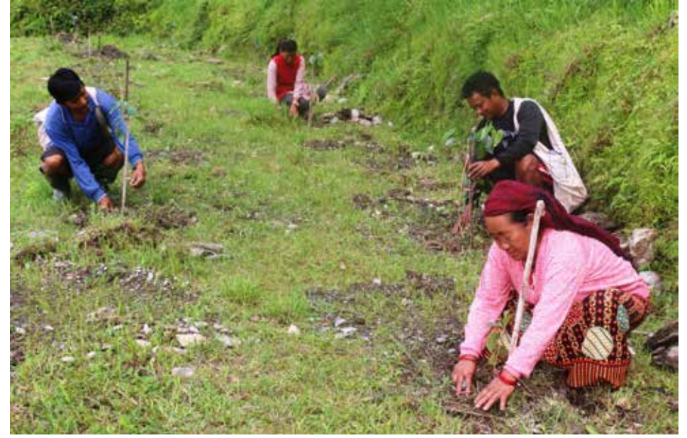
कफीको बिरुवा रोप्दै अर्मलाकोटवासी : बाँझो जग्गामा कफीका बिरुवा रोप्दै पोखरा-१६, अर्मलाकोटवासी। सामूहिक रूपमा उनीहरूले यस पटक २०० कफीका बिरुवा रोपेका छन्।