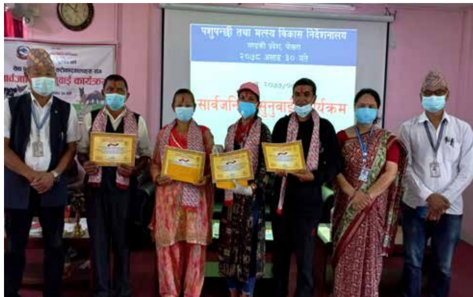
कृषक पुरस्कार ग्रहण : गण्डकी प्रदेशको भूमि व्यवस्था कृषि तथा सहकारी मन्त्रालय मातहतको पशुपन्छी तथा मत्स्य विकास निर्देशनालयबाट यसवर्ष विभिन्न विधामा उत्कृष्ट हुन सफल कृषकहरू बुधवार पुरस्कार ग्रहणपछि । निर्देशनालय उत्कृष्ट १० कृषकलाई जनही रु २० हजारका दरले पुरस्कार प्रदान गरेको हो ।