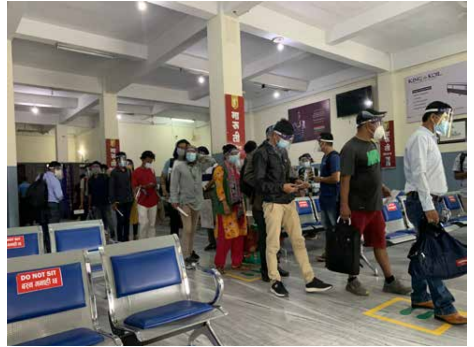
लाइनमा बसेका यात्रु : पोखरा विमानस्थलमा शनिबार गेट पासका लागि लाइनमा बसेका यात्रु।