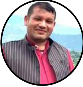
११ औं दिनको पुण्य तिथिमा

अन्य कुनै पनि कार्यमा व्यस्त भए पनि अथवा अन्य कुनै रोग र बिरामीको कारणले होस् श्वास फेरीरहेको जीवनमा मृत्युले छोप्छ । यी त सबै मृत्युका बहाना मात्र हुन् ।